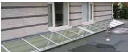
Lessenaarsdak tegen muur (LDM)

Het Luxlight-assortiment bestaat uit 3 typen platdakramen: