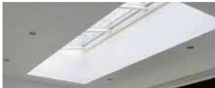
Lessenaarsdak vrijstaand (LDV)