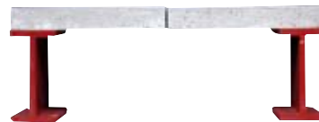
Kifbeton op staal