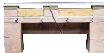
Moer- en kinderbalken