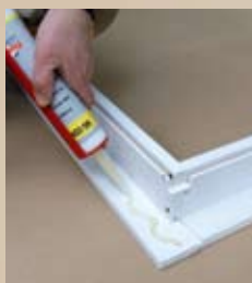
4 Lijm aanbrengen