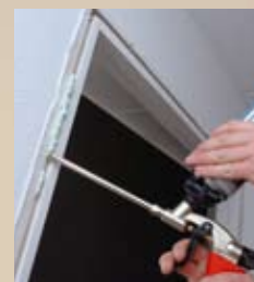
6 Porschuim aanbrengen