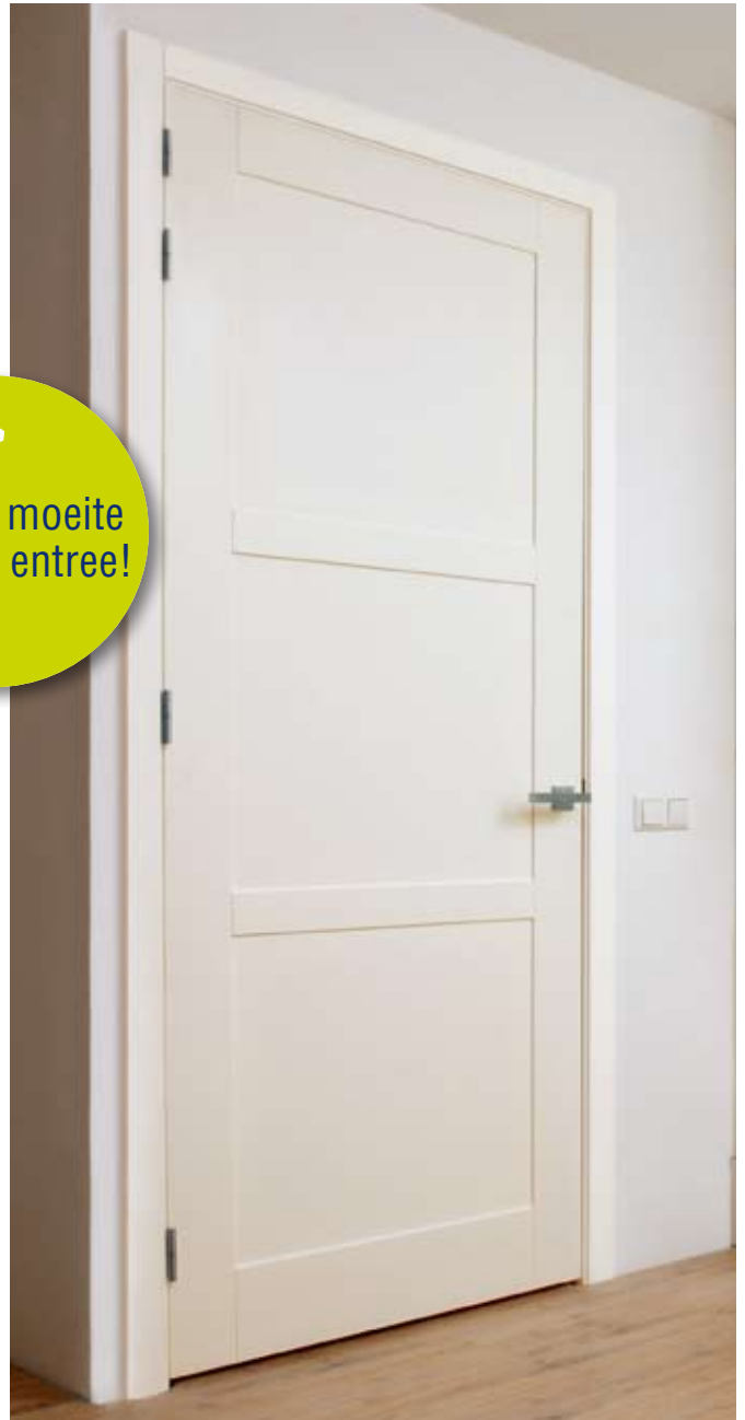
Stompe deur met stijlvol houten Ecosy Kozijn