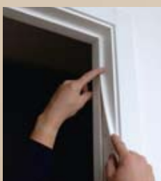
7 Sponningrubber plaatsen