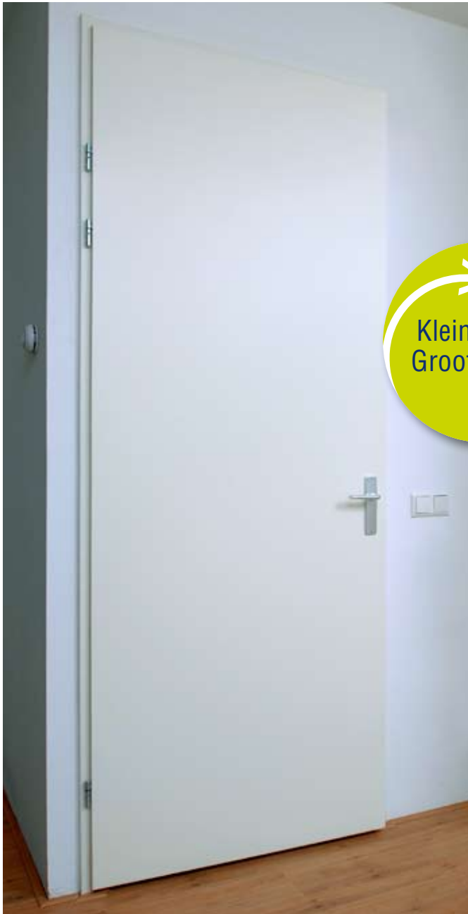
Opdekdeur met standaard stalen kozijn