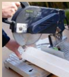
2 Opmeten en inkorten