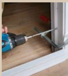
5 Ecosy Kozijn plaatsen