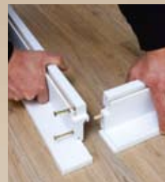
3 Stijlen aan dorpel vastschroeven