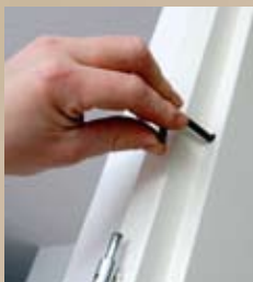
1 Oude stalen montagekozijn verwijderen