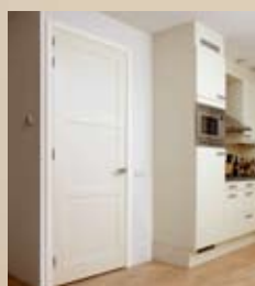
8 Deur afhangen